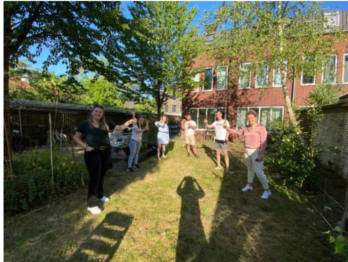
Het bestuur borrelt op 1,5 meter afstand!

Liefs! Take care! (En hopelijk tot heel snel!)