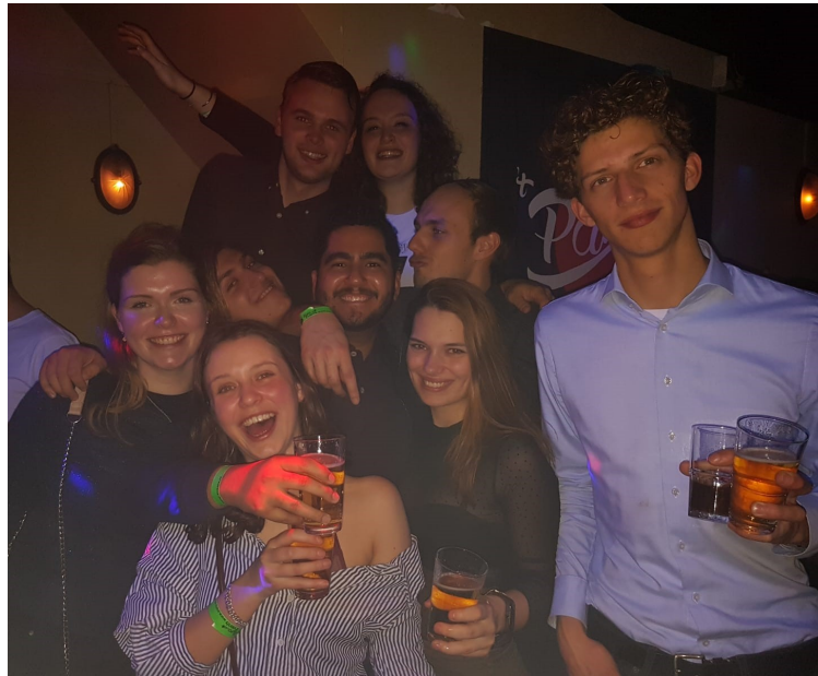
Codexianen onder elkaar tijdens een gezellige kroegentocht!